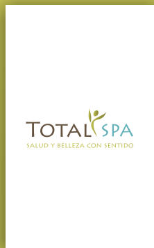
TARJETA DE PRESENTACIÓN